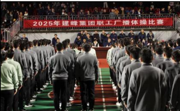
建峰集团职工广播体操比赛