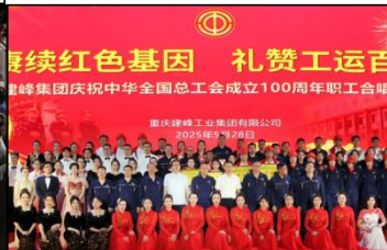
建峰集团职工大合唱比赛