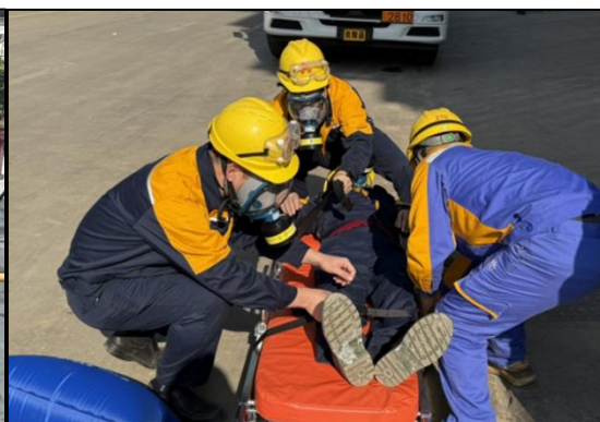
聚狮新材料开展周边企业氯气泄漏事故应急疏散演练