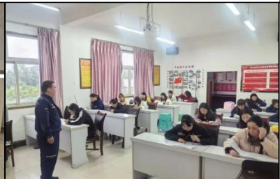
紫光国际化学检验分析技能竞赛