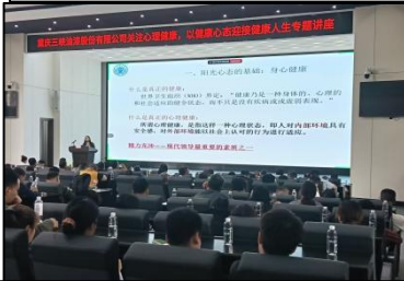
三峡油漆职工心理健康讲座