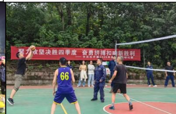
卡贝乐职工排球比赛