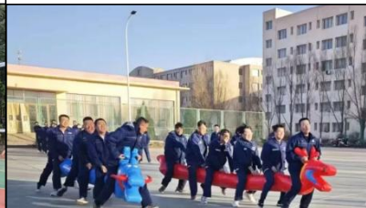
宁夏蛋氨酸职工文化艺术节活动