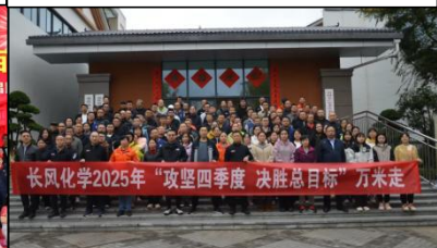
长风化学职工万步走活动