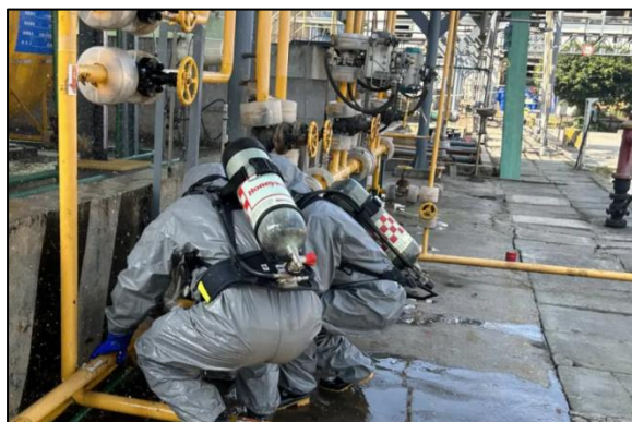
紫光国际开展重大危险源泄露事故应急演练

一是及时调整、补充应急救援队伍人员，加强人员培训，按标准准备足备齐应急物资。二是全系统共有安全环保各类应急预案718个，其中综合预案58个，专项预案153个，现场处置预案507个，按照年度演练计划及相关要求，组织开展综合预案、专项预案和现场处置方案演练共1136次，20030人次参与。四是严格落实24小时专人值班和领导干部在岗带班、外出报备及紧急信息报送制度。