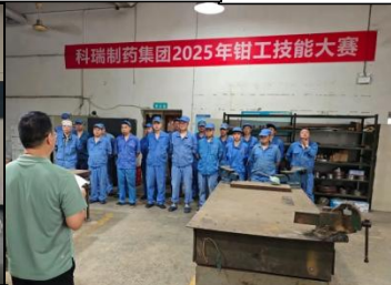
科瑞制药钳工技能竞赛