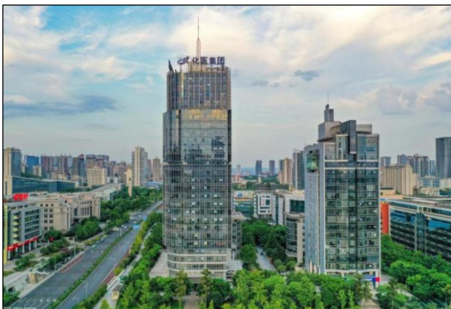
重庆化医集团大楼

重庆化医控股(集团)公司(以下简称重庆化医集团或集团)成立于 2000 年 8 月,是重庆市政府出资组建的一家集研发、生产、营销为一体的国有独资大型控股集团公司,拥有上市公司渝三峡,下属全级次企业 69 户,从业人员 1.1 万余人。重庆化医集团旗下产业涉及化工、新材料、新服务业等生产和销售领域,主要分布在重庆长寿、涪陵、垫江、潼南、江津以及宁夏、内蒙等地。2025 年位列中国企业 500 强第 273 位,中国制造业企业 500 强第 139 位,重庆企业 100 强第 5 位,重庆制造业企业 100 强第 4 位。