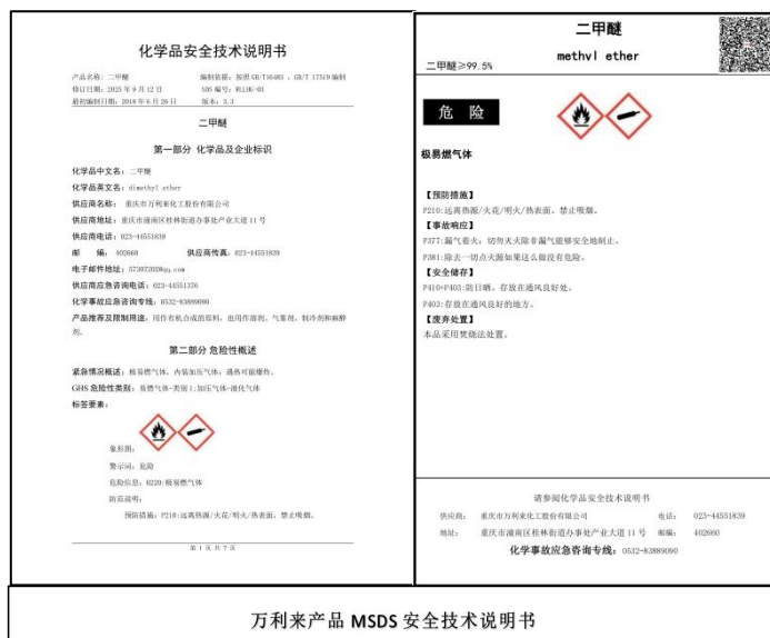
万利来产品 MSDS 安全技术说明书

段，严把各工艺环节控制指标，采用现代化的操作工艺和监控手段，强化员工精心操作，保证较高的产出率及产品合格率。六是对产品MSDS安全技术说明书及时更新，并向客户发放。