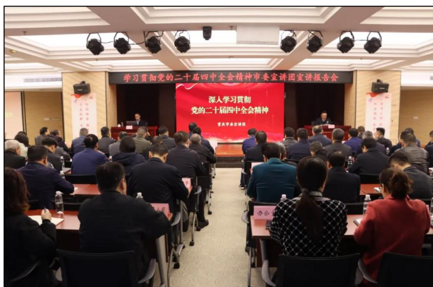
重庆化医集团学习贯彻党的二十大精神

讲话重要指示精神，全面学习贯彻党的二十大和二十届历次全会精神，认真落实市委六届七次、八次全会部署，坚持和加强党的全面领导，深化巩固党的各项建设。严格党委会“第一议题”学习 203 篇，传达上级文件 127 篇，制定落实措施 81 条。通过“第一议题”、中心组集中学习等方式深入学习领会习近平生态文明思想和习近平总书记关于安全生产的重要论述。制定贯彻落实市委六届七次、八次全会部署要求的重点举措 27 项打表推进。切实推动党建与生产经营深度融合，制定党建统领“止损治亏”工作方案，成立工作专班，建立“一企一策”分类治理措施台账务实推进。建立赛马比拼、定期调度、专班推进等十项协调联动工作机制，营造比学赶超氛围。产能释放率提高 0.2 个百分点至 95.5%，产销率提高 0.5 个百分点至 100.4%；盘活存量资产账面值 28.48 亿元，收回资金 46.51 亿元；资产负债率降至 69.41%；平均融资成本降至 3.99%。抓实安全环保信访稳定各项工作，全力营造积极向上的改革发展环境。