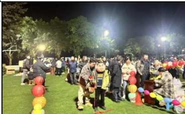
天原化工职工游园活动